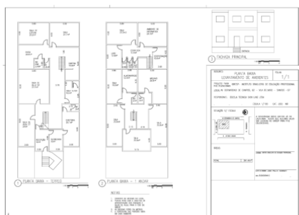
Fig. 4 – Planta baixa

Verificou-se que o Polo de Santos atende às normas de acessibilidade da ABNT NBR 9050, dispondo de rampa de acesso, piso antiderrapante e tátil, salas no térreo, sanitários acessíveis, identificação em Braille, cadeira de comorbidade e vagas demarcadas para pessoas com deficiência. A infraestrutura disponível é adequada às atividades presenciais e compatível com o número de vagas ofertadas, contando também com equipe qualificada e orientações institucionais para o atendimento inclusivo e não discriminatório.