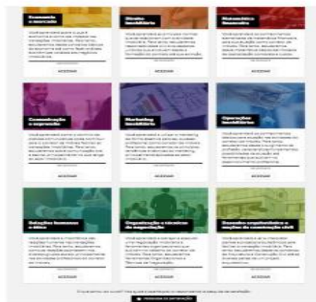
Fig 2. Plataforma do aluno para acesso ao material didático

Quanto ao material físico, o IBRESP - Instituto de Educação Profissional do Estado de São Paulo Ltda disponibiliza um conjunto de apostilas referentes a cada componente curricular, estruturadas em unidades didáticas que compreendem introdução ao tema como um fator motivador para a aquisição das competências e habilidades específicas conteúdos associados a situações da prática profissional; testes; glossários e bibliografias. O conjunto de materiais visa estimular o estudo e a fixação de conhecimentos, utilizando, além de imagens, recursos recomendados para apoiar o autoestudo na modalidade a distância, entre eles, chamadas no texto como: "conceito", "importante", "para refletir", "em resumo" e "saiba mais". (Fig.3)