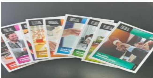
Fig. 3 – Material didático impresso

Os materiais didáticos do Curso Técnico em Transações Imobiliárias (TTI) passam por revisões contínuas realizadas por especialistas, assegurando atualidade e qualidade dos conteúdos. O acompanhamento do estudante ocorre de forma permanente por tutor responsável por apoiar, orientar, motivar e avaliar o desempenho acadêmico. Atendimentos e plantões de dúvidas são ofertados presencialmente e virtualmente, com horários divulgados no AVA.